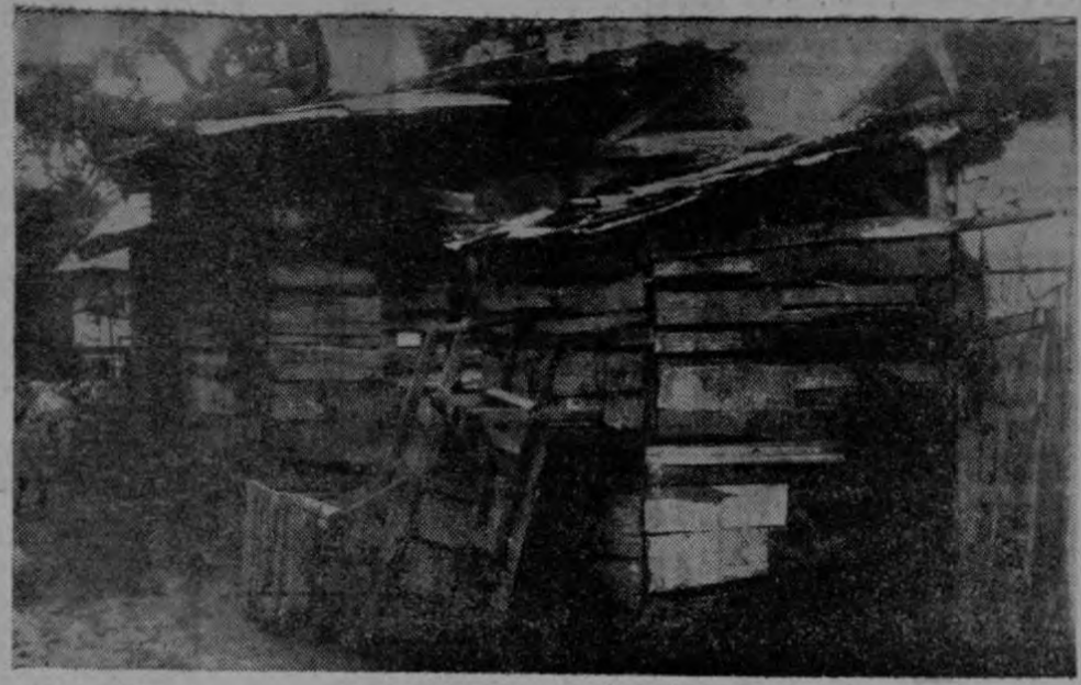
EL TUGURIO nace por la necesidad de la gente. Los caseros los construyen para alquilar explotando la miseria humana. Todos los sobros se utilizan para construir el tugurio: cuartucho inmundo, sórdido e infeliz.