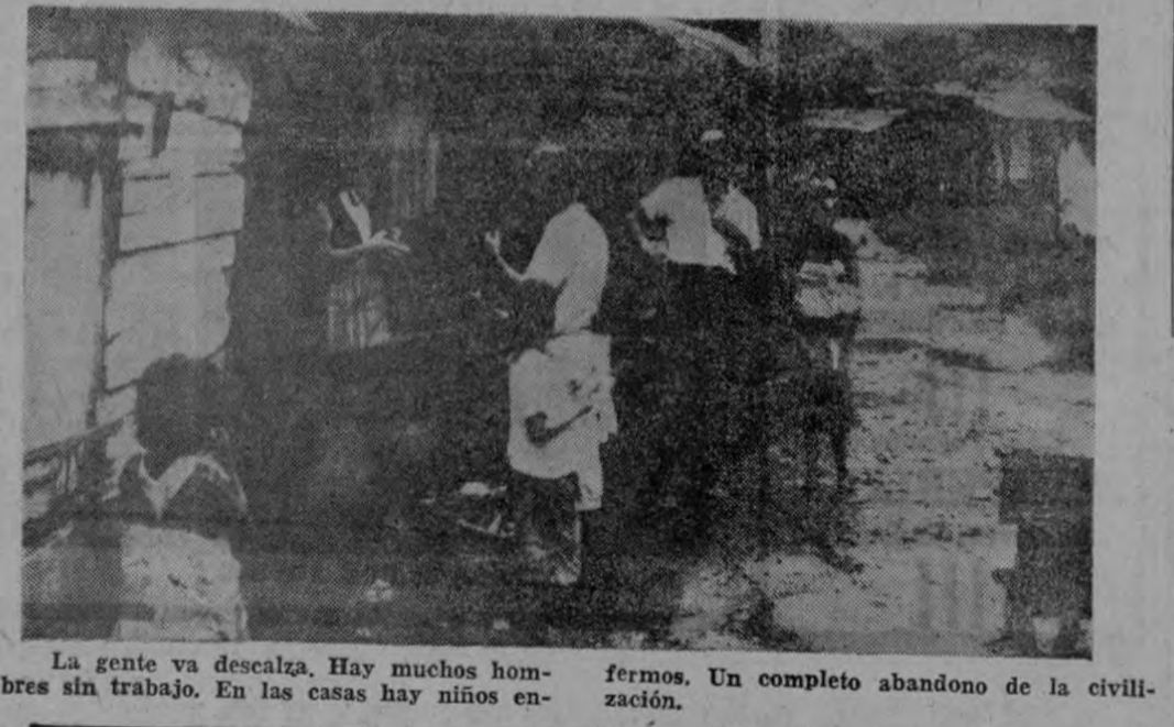
La gente va descalza. Hay muchos hombres sin trabajo. En las casas hay niños enfermos. Un completo abandono de la civilización.